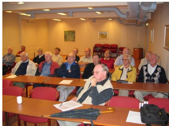
Over: To foto fra møtelokalene i Quality Hotel Ringerike "Hønefoss-rommet", 26. august 2003.