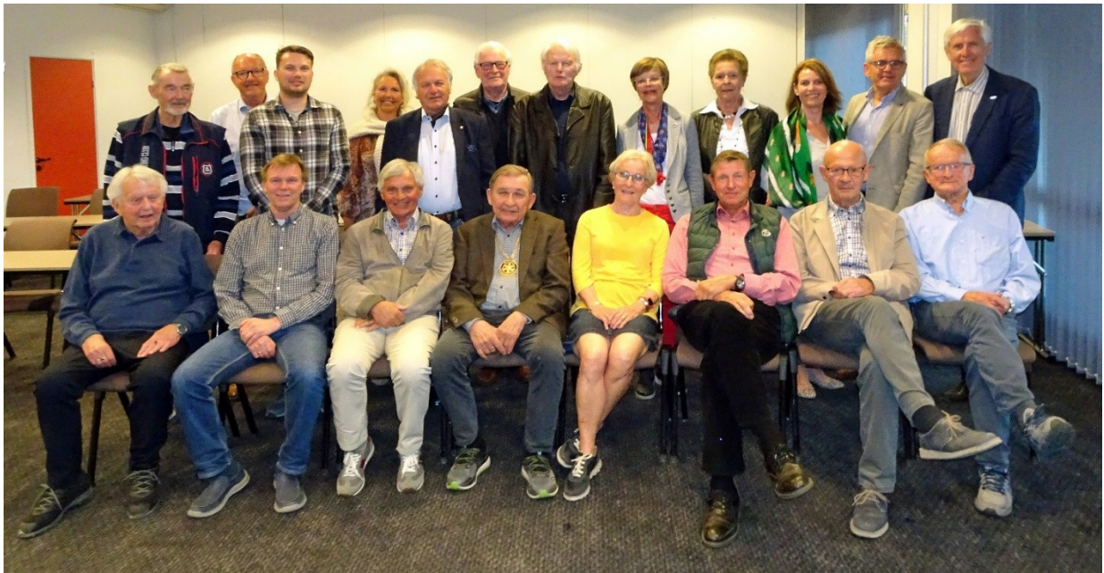
Deltagerne på Hønefoss-Øst Rotary-klubbs møte 23. april 2019 i Scandic Hotel.