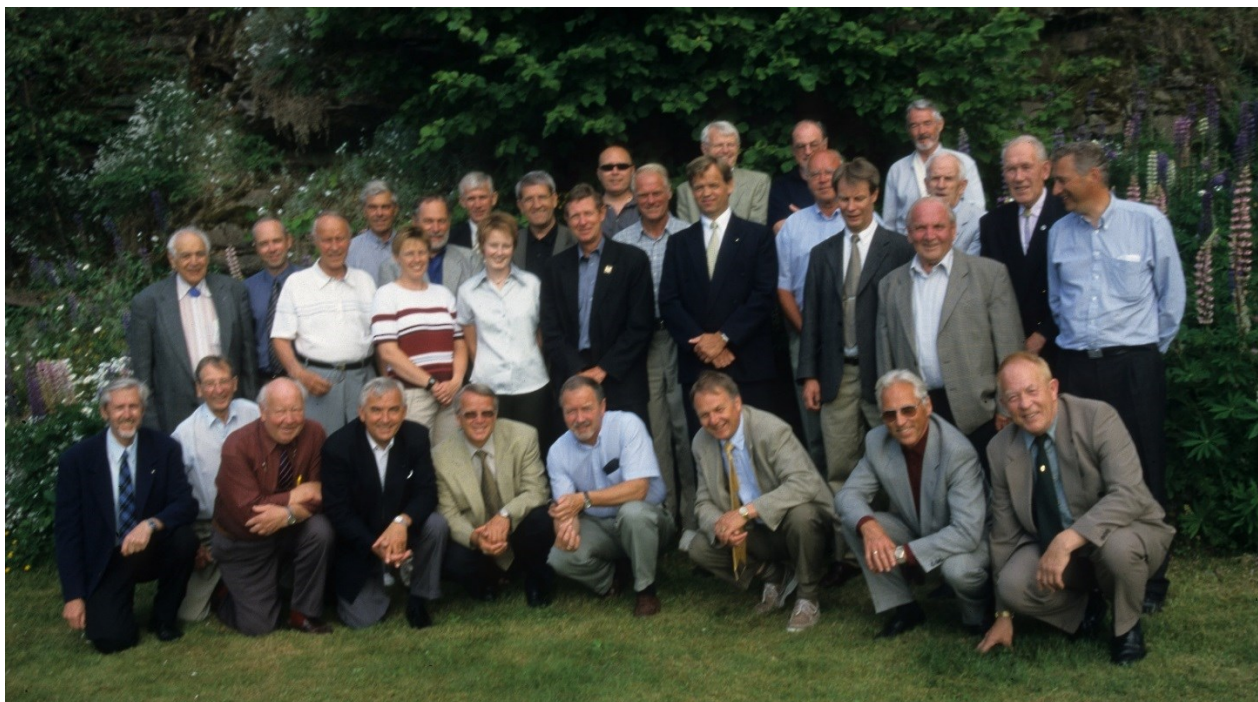
Foto fra ulike arrangementer i Hønefoss-Øst Rotary-klubb i tiden 2001 - 2019