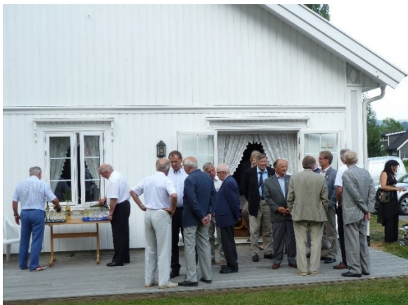
Presidentskiftet juni 2010, på Benterudstua.