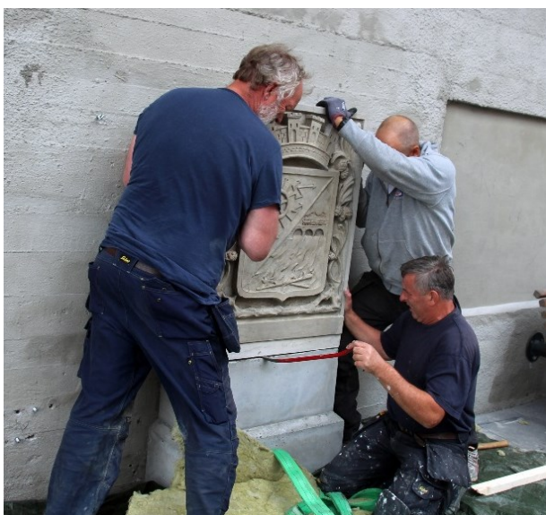
Byvåpenrelieffet klargjøres for avduking 25. august 2018 ved Pottemakerbakken i Hønefoss (Nordsida). Et samarbeidsprosjekt mellom Hønefoss-Ringerike RK og Hønefoss-Øst RK. (WH)