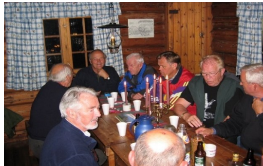
Over: To foto fra skauturen til Retthella 13. september 2005.